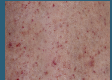
Voorbeeld van petechiën